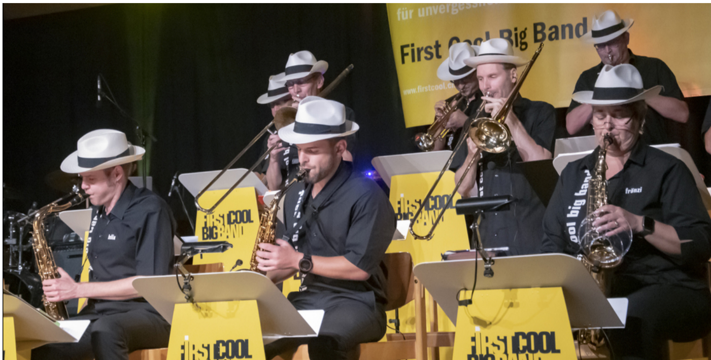
Das Ensemble First Cool Big Band eröffnete am Freitag die Jazz- und Blues Days und überzeugte mit Funk, Balladen und witzigen Jazzstücken.